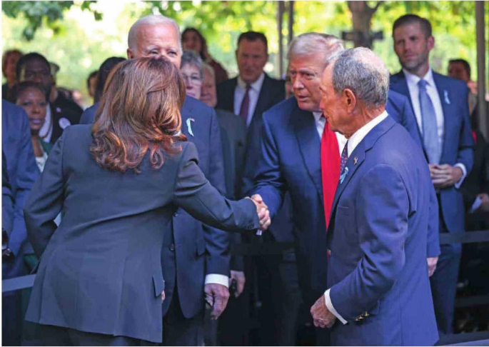
Harris y Trump se saludan antes de iniciarse la ceremonia en recuerdo del 11 de septiembre.

Renuente. Trump, quien criticó a los moderadores, duda de participar en otro enfrentamiento.