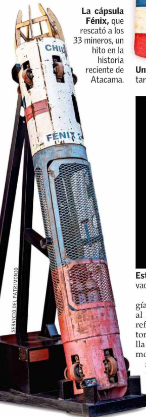
La cápsula Fénix, que rescató a los 33 mineros, un hito en la historia reciente de Atacama.