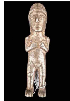
Estatuilla hallada en una excavación del volcán Copiapó.

una experiencia educativa con tecnologías, como la pantalla esférica led o las proyecciones del cielo atacameño, donde cada visitante podrá proponer “su propia constelación”, elaborada con objetos escogidos de la muestra. Entre ellos figura la cápsula Fénix, que en 2010 permitió el rescate de los 33 mineros atrapados bajo tierra. “La consolidación del Museo Regional de Atacama robustece la inversión en infraestructuras patrimoniales de alta calidad arquitectónica, técnica y científica”, dice la ministra de las Culturas, Carolina Arredondo.