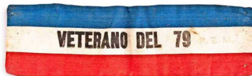
Un valioso brazalete conmemorativo que entregaba la Sociedad de Militares, Civiles y Veteranos del 79, sobrevivientes de la Guerra del Pacífico.