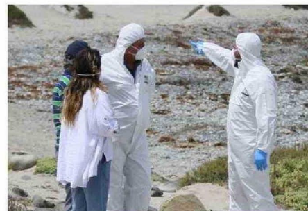
TAMBIÉN PARTICIPÓ DEL OPERATIVO EL PERSONAL DE SERNAPESCA.