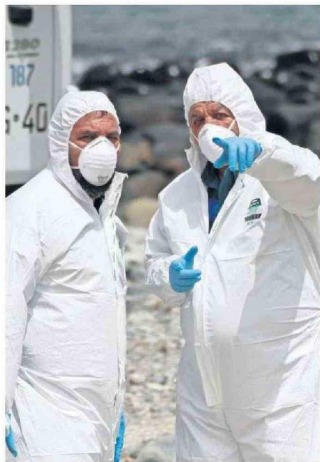
EN EL OPERATIVO HIZO ACTO DE PRESENCIA EL ALCALDE DE COPIAPO.