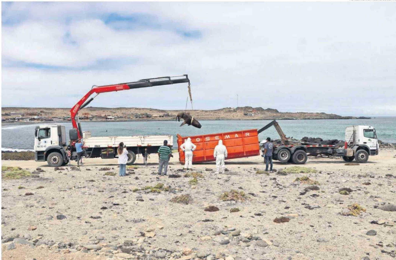
LA CALETA PAJONALES, SITIO DONDE SE LLEVÓ A CABO ESTE OPERATIVO DE RETIRO DE CUERPO, FORMA PARTE DE LA JURISPRUDENCIA DE COPIAPO Y ESTÁ UBICADA A 22 KILÓMETROS AL NORTE DE TOTORAL.