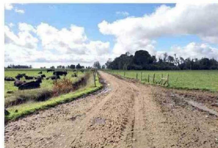
EL PREDIO DEL PARQUE EÓLICO OCUPA UNAS 237,43 HECTÁREAS.

En su resolución, el SEA Los Lagos argumenta que se dan "las condiciones establecidas en el artículo 6 N°1 letra a) del Convenio 169 de la OIT y que, por lo mismo, resulta procedente que se lleve a efecto un proceso de consulta a pueblos indígenas".