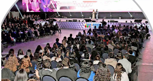
Una amplia convocatoria tuvo el IX Encuentro por los Jóvenes de la Alianza del Pacífico.