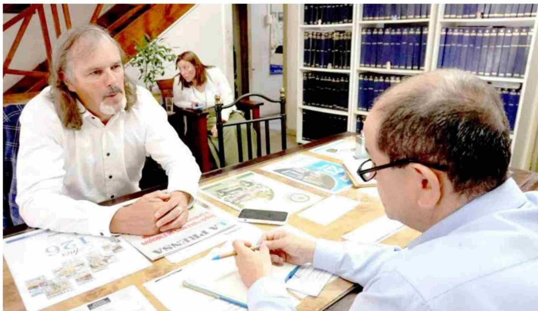
José Miguel Benavente, vicepresidente ejecutivo de Corfo, estuvo en las instalaciones de diario La Prensa: "Son muy importantes los medios regionales, por su cercanía con la gente", dijo.

"Por supuesto, y eso es lo más interesante. Quieren llegar a Estados Unidos, no solo con la miel, sino también con las exportaciones de las abejas reinas, pero hay que cumplir con un conjunto de condiciones fitosanitarias. La cantidad de participantes