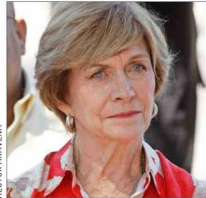
Evelyn Matthei candidata proclamada por la UDI y RN.

De hecho, apuntó directamente contra el exministro Ignacio Briones (Evópoli): "Sin ir más lejos, la