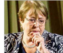
Michelle Bachelet, exministra en dos períodos.

Al frenesí que supone retomar una nutrida agenda legislativa