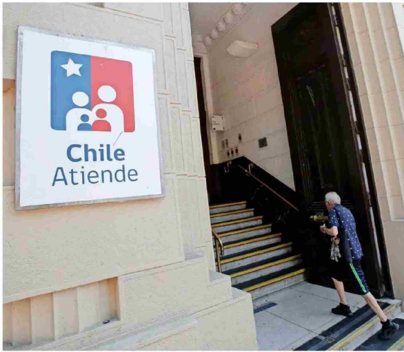
ChileAtiende, como la puerta de entrada a beneficios y servicios del Estado, es altamente valorado.