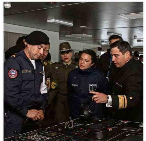
A LAS 8.30 HORAS RECALÓ EL "ALMIRANTE VIEL", QUE ZARPARÁ MAÑANA.

El capitán Enríquez destacó que el navío obtuvo su clasificación polar Ice Class PC5, que otorgó la empresa Lloyd's Register, lo que le permite "cumplir con todas las normativas que se exige a los buques que operan en aguas polares", pudiendo navegar incluso más al sur del Círculo Polar Antártico. "El buque tiene la capacidad de romper hasta un metro de hielo (gracias a su casco de