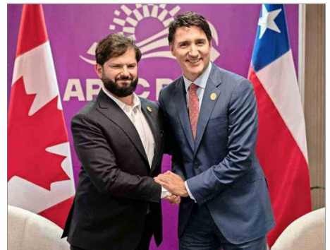
El mandatario también estuvo con el Primer Ministro canadiense, Justin Trudeau.