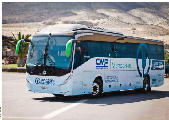
Con el objetivo de acelerar el proceso de reducción de emisiones en sus operaciones, CMP presentó la primera flota de buses de transporte para trabajadores, 100% eléctrica para la industria de la minería, la que además será suministrada por energía proveniente de fuentes renovables.