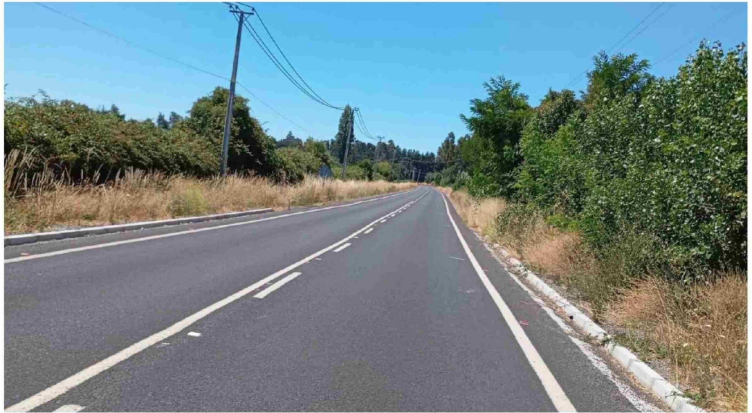
LOS PASTIZALES A ORILLAS del camino a Cerro Colorado preocupan a los residentes.

Las imágenes que acompañan esta nota muestran la evidente acumulación de pastizales a las orillas del camino, ilustrando el riesgo que esto podría significar para la comunidad y el medio ambiente en caso de registrarse un incendio.