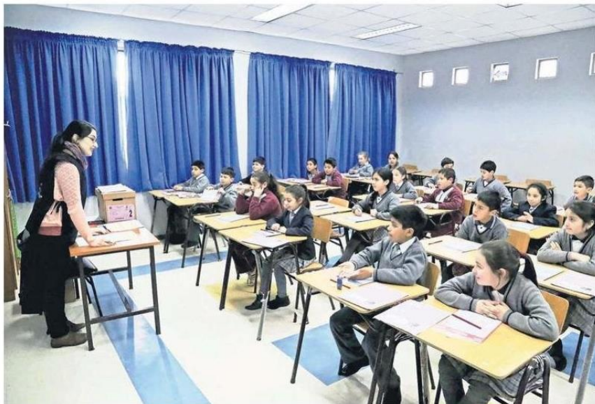
Una formación cívica es clave para que las nuevas generaciones entiendan la importancia de procesos como el que se registrará en el país en pocos días más.