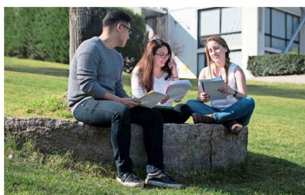
Estudiantes, académicos y colaboradores participaron en el proceso.

La próxima visita de pares evaluadores MSCHE a la U. Mayor quedó establecida para el período 2031-2032.