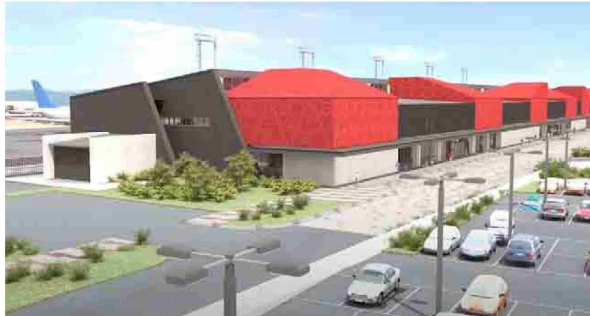
Pese a las críticas que surgieron en su momento, desde el MOP apostaron por un diseño modernista para la fachada del aeropuerto de La Serena.

Lo cierto es que dicho relato, lamentablemente se ha ido transformando en una situación habitual para muchos pasajeros, sobre todo en los meses fríos. Por ello, cada vez que se repiten historias como éstas, se reabre el debate sobre la modernización del