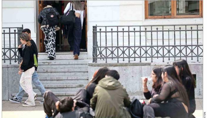
ESCENARIO.— El proyecto del FES frena la ampliación de la política de la gratuidad y traspassa de manera obligada al nuevo sistema a los deudores morosos del CAE cuyas garantías de sus créditos fueron ejecutadas.

del Ejecutivo causará un detrimento económico para las instituciones: “Lo va a provocar en la medida que no haya maneras más sustantivas de apoyar el fi-