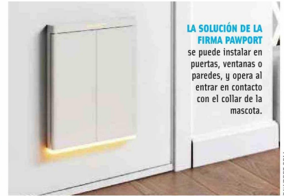
LA SOLUCIÓN DE LA FIRMA PAWPORT se puede instalar en puertas, ventanas o paredes, y opera al entrar en contacto con el collar de la mascota.

Para los pájaros también han surgido innovaciones, como el Birdfy Bath Pro, un baño inteligente equipa-