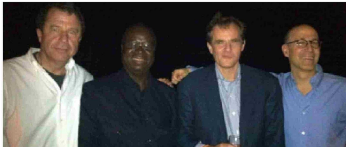
Sebastián Edwards y Simon Johnson (el tercero de izquierda a derecha), en África en 2012.

cerlos y haber aprendido mucho de ellos. Fui compañero de Simon (Johnson) en MIT donde además teníamos ambos de profesor guía a Rudi Dornbusch, y hasta hace poco éramos colegas en el Peterson Institute for International Economics. En tanto Jim y Daron, son muy amigos de Chile y han venido varias veces. Daron tiene exalumnos chilenos y durante la pandemia lo tuvimos dando una conferencia online en la FEN”.