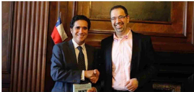
Daron Acemoglu en 2020 en las oficinas de Hacienda junto al entonces ministro, Ignacio Briones.

Por su parte, el decano de la FEN de la U. de Chile y doctor en Economía del MIT, José De Gregorio, indica que “tengo la suerte de cono-