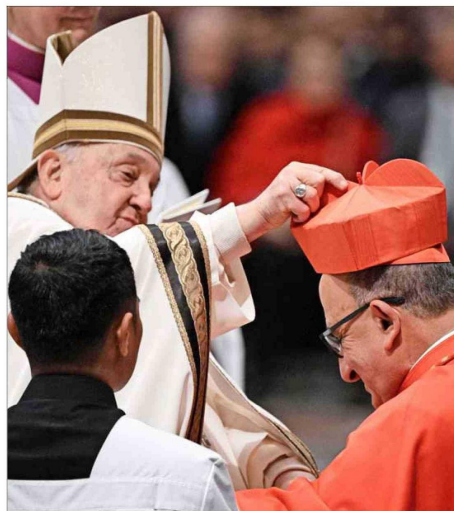
SÍMBOLOS. — De manos del Papa, el arzobispo de Santiago recibió la birreta roja, que simboliza la disposición a defender la fe, y el anillo cardenalicio.

Sobre las responsabilidades que conlleva ser nombrado como cardenal, el historiador Cris-