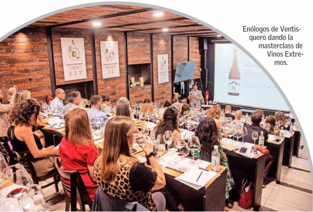
Enólogos de Ventisquero dando la masterclass de Vinos Extremos.