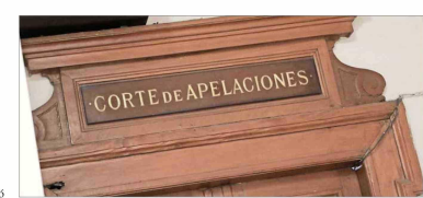
UNÁNIME —La decisión de la Corte de Apelaciones de Santiago se adoptó de manera unánime.

Si bien, en 2018, el entonces contralor Jorge Bermúdez estableció un criterio mediante el cual se aplicaba la confianza legítima cuando un funcionario cumplía dos años en su puesto, es decir, que podía tener la legítima expectativa de que fuera renovado en su cargo al cabo de ese tiempo; pero, en no-