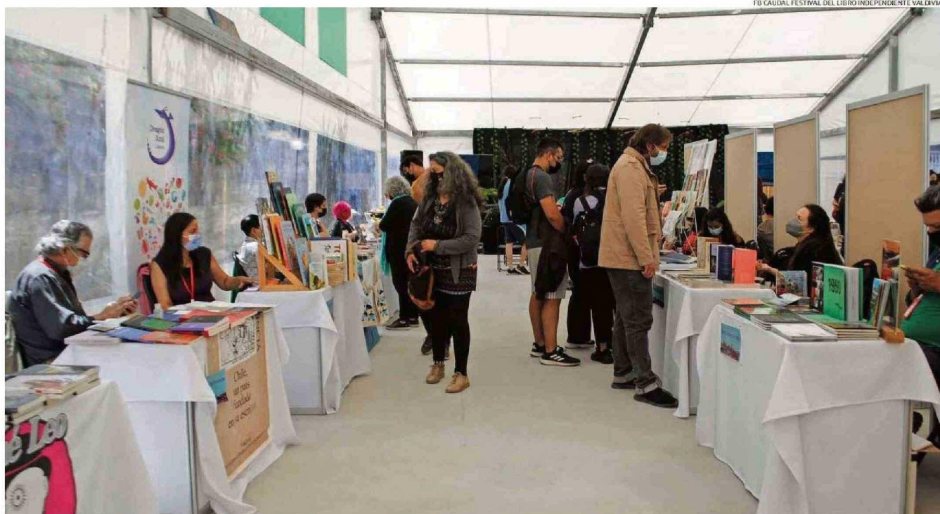
EN 2022 CAUDAL REGRESÓ A LA PRESENCIALIDAD EN MEDIO DE LA PANDEMIA CON ACTIVIDADES EN EL CENTRO DE EXTENSIÓN CAMPUS LOS CAÑELOS DE LA UNIVERSIDAD AUSTRAL DE CHILE.