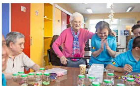
Cristo Especial acoge durante el día a 22 niños, jóvenes y adultos con discapacidades físicas e intelectuales.