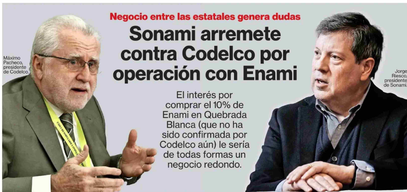
Máximo Pacheco, presidente de Codelco.