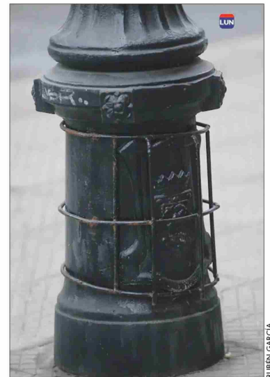
Las luminarias municipales, de color verde, ya cuentan con rejillas protectoras.