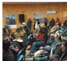
DESTACARON EL APOYO.