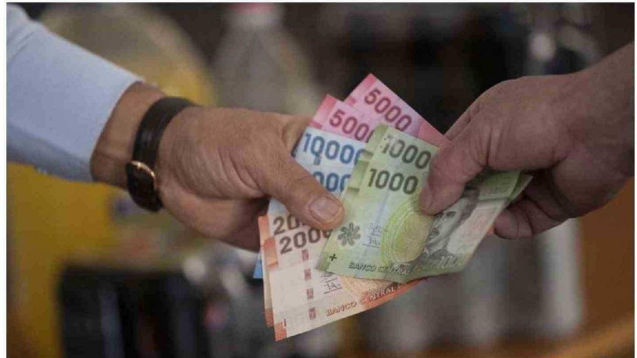
DESDE 2017 QUE LA REGIÓN DE LA ARAUCANÍA REGISTRA EL MAYOR PORCENTAJE DE PERSONAS DEMANDADAS EN LA MACROZONA SUR, SEGUIDA POR LOS LAGOS Y LOS RÍOS.

Desde Unholster destacan la relevancia de realizar análisis como este. "El estudio no sólo muestra la creciente problemática del endeudamiento en Chi-