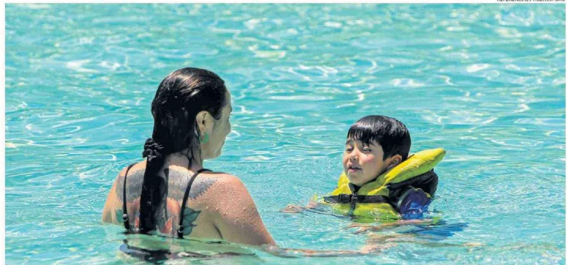
ANTE CUALQUIER INFRACCIÓN QUE DETECTE, DEBE PRESENTAR UNA SOLICITUD DE FISCALIZACIÓN EN EL SITIO WEB DEL MINSAL.

Las principales condiciones que se verifican en las fiscalizaciones son: contar con autorización sanitaria que permite su funcionamiento, calidad del agua de la pileta de manera tal que contenga los niveles de Cloro y pH re-