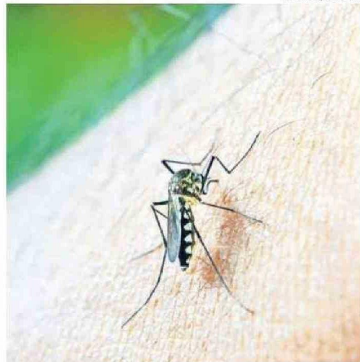
PICADURAS DE INSECTOS Y ARÁCNIDOS SON CASOS DE CONSULTA.