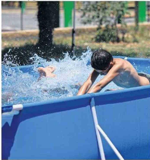
INFECCIONES Y ASFIXIAS POR INMERSIÓN AUMENTAN EN VERANO.