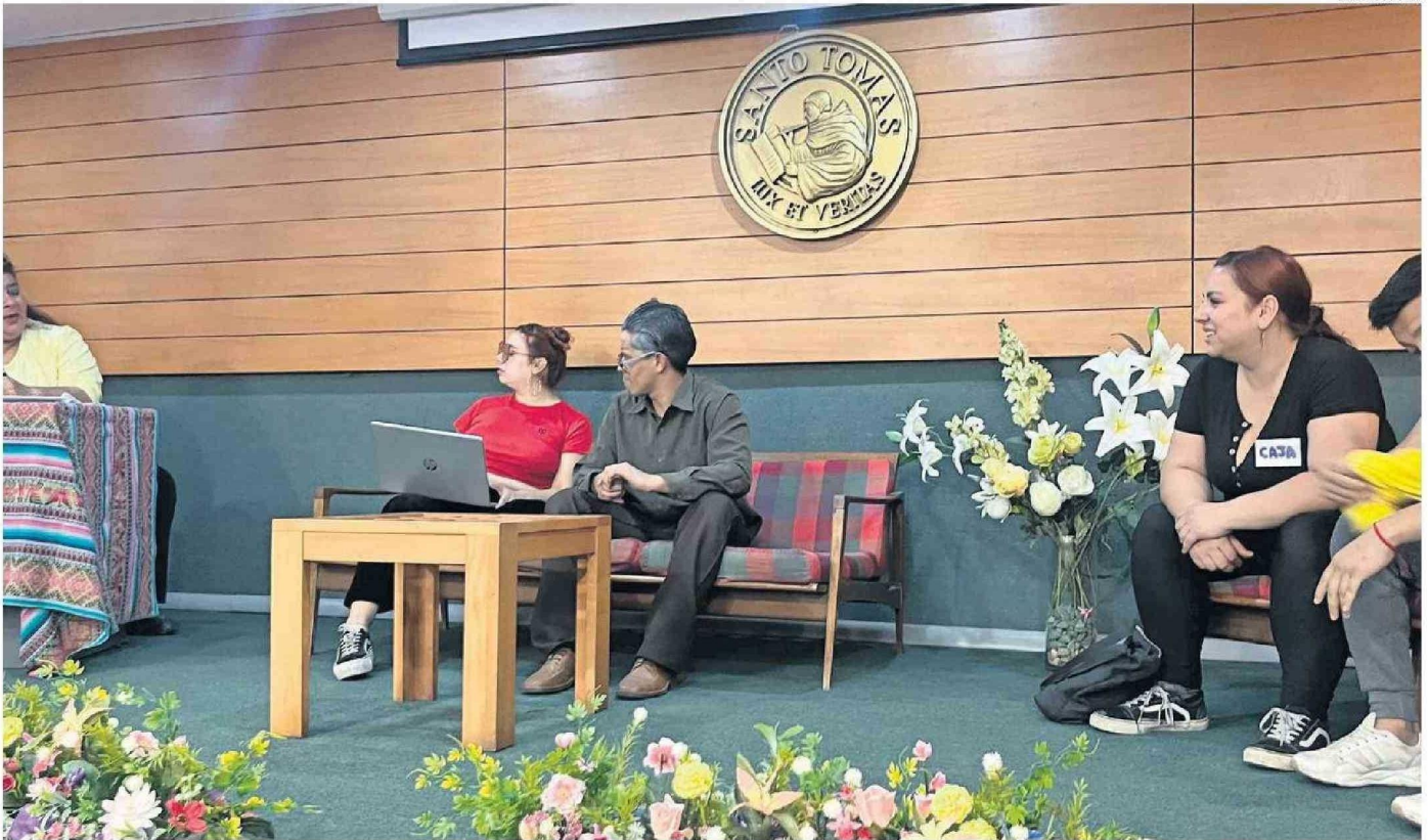
LA OBRA CON HUMOR Y EDUCACIÓN AYUDA A L ESPECTADOR A ENTENDER MEJOR EL TEMA DE LA PREVISIÓN SOCIAL

La agrupación se presentará en el Ex Casino con su obra que llega a la ciudad luego de recorrer distintos puntos.