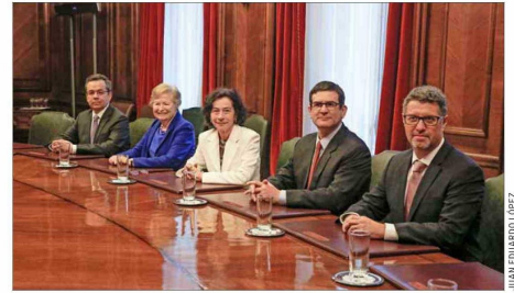
El Consejo del Banco Central decidió por la unanimidad de sus miembros rebajar en 50 puntos base la TPM.