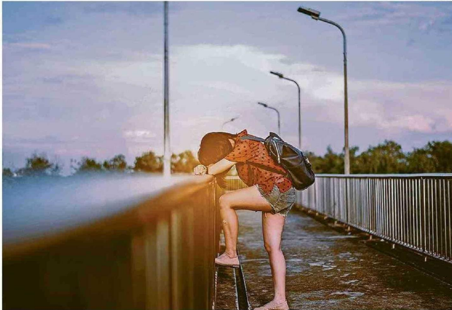
LA ORGANIZACIÓN MUNDIAL DE LA SALUD (OMS) ASEGURA QUE EL SUICIDIO ES UN PROBLEMA DE SALUD PÚBLICA A NIVEL GLOBAL.

“El proyecto se originó a partir de la identificación de una necesidad urgente en la Región de La Araucanía: las alarmantes tasas de suicidio, que colocan a esta área como una de las regiones con índices más elevados en el país. Este contexto nos llevó a reflexionar sobre el potencial de la fonoaudiología para abordar esta comple-