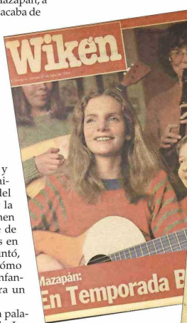
Mazapán y su presencia en “El Mercurio” en los años 80.