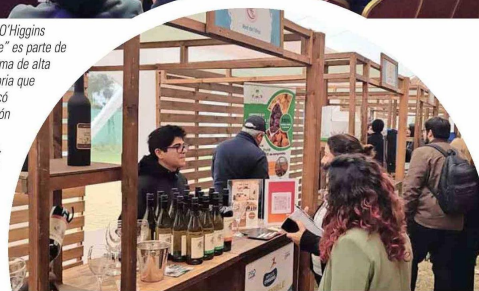
El evento internacional "Impulsa O'Higgins Sostenible" contó con una muestra de emprendimientos sostenibles relacionados con la economía circular y la adaptación al cambio climático.