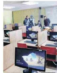
dejar de lado su formación formal”.

“Por otra parte que La Moneda ponga énfasis en la educación rural de nuestros pueblos del Alto Loa. Ahí también deben haber avances y que permitan a las comunidades, a nuestros pueblos originarios a entregarles mejoras en sus instalaciones y herramientas educativas, y que esta vaya siempre con respeto a las tradiciones y costumbres propias, sin