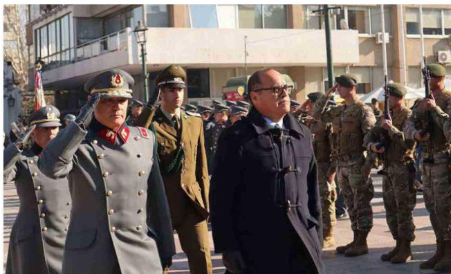
El acto comenzó con los honores al delegado presidencial Fabio López.