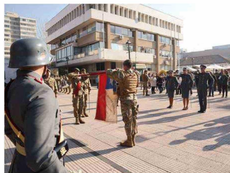
Sellaron su compromiso con la patria, 94 soldados: 3 oficiales, 14 suboficiales, 2 suboficiales de reserva, 2 soldados de tropa profesional y 73 soldados conscriptos de la BAVE