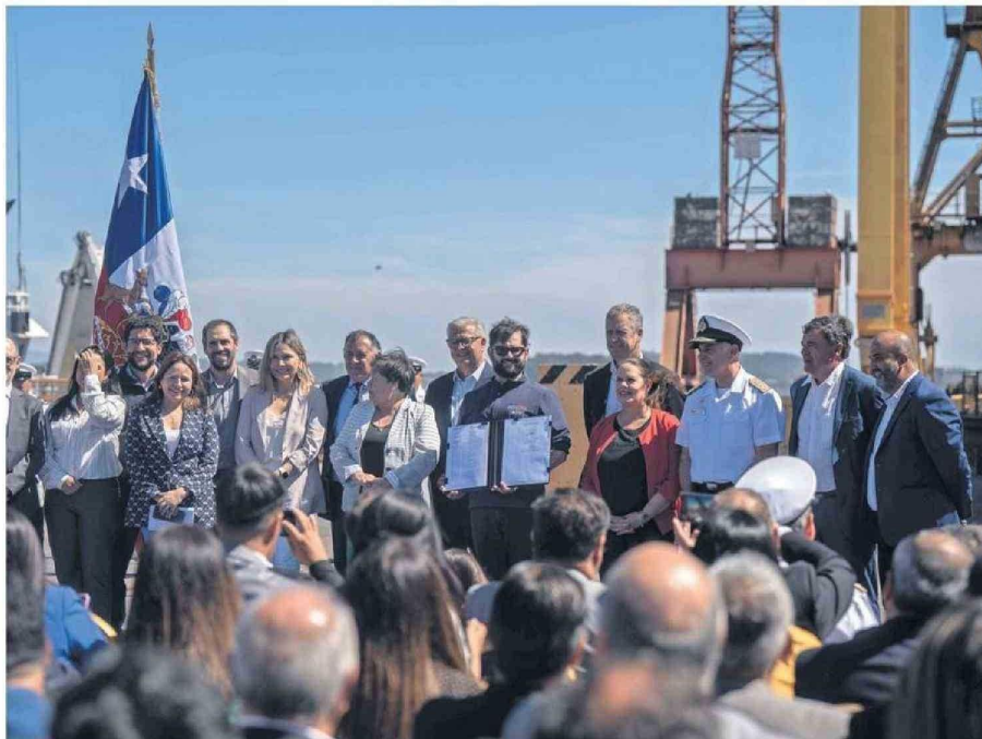
El Mandatario, autoridades políticas y navales firmaron la creación del plan naval.

Además, indicó que "estas políticas se deben convertir en políticas de Estado, porque también es más soberanía nacional, tiene como objetivos la renovación y mantención de la escuadra, o sea estamos hablando del largo plazo", y valoró que "estamos desarrollando capacidades que van a ser no sólo enviadas en la Región, sino seguramente solicitadas. Además, esto es parte de la creación del polo industrial para toda la Región que genera valor