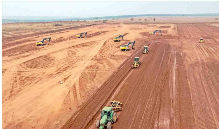
La firma chilena comenzó los movimientos de tierra en Brasil para la construcción del Proyecto Sucuriú, que tendrá una planta con capacidad de producción anual de 3,5 millones de toneladas de celulosa.

la empresa está ligada al ambiente internacional. Al respecto, Navarro señaló que "seguimos viendo un ambiente de alta incertidumbre. A los riesgos geopolíticos que veníamos observando en los años anteriores, muchos de ellos asociados a conflictos bélicos que han durado un largo período, hoy día se suma una agudización de la guerra comercial de las grandes potencias, que han estado anunciando restricciones en el comercio internacional, incluso poniendo en duda un paradigma como la globalización, que parecía bas-