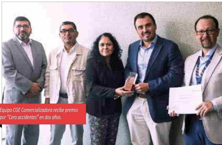
Equipo CGE Comercializadora recibe premio por “Cero accidentes” en dos años.

“Recibir el premio ‘Cero Accidentes’ por parte de Mutual de Seguridad es más que un reconocimiento. Es el reflejo de un compromiso profundo de CGE Comercializadora con la seguridad y el bienestar de cada persona que forma parte de este viaje”, concluye.