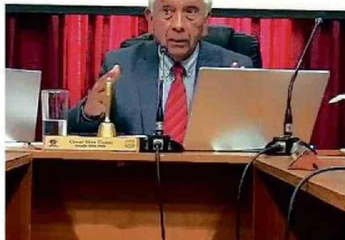
ALCALDE DIO LOS DETALLES CUANDO SE HABLABA DE VEREDAS.

el puente actual o avanzar con el diseño elaborado por el Serviu.