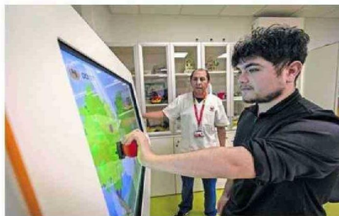
EL CENTRO CUENTA HOY CON MODERNAS TECNOLOGÍAS.

Junto con mejorar las áreas de atención terapéutica e incorporar medidas de eficiencia energética el centro sumó modernos dispositivos de rehabilitación robótica, que permiten potenciar los avances de los usuarios del centro.