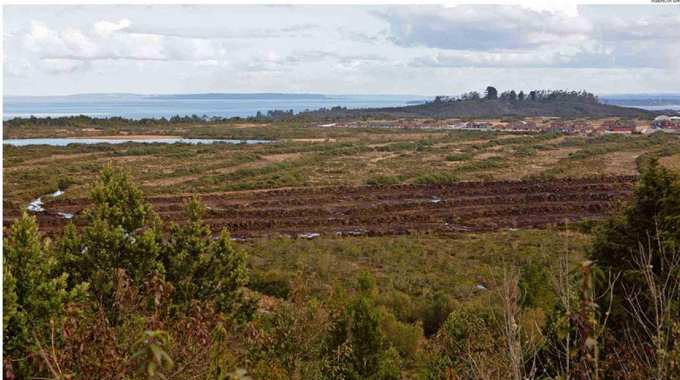
LO OCURRIDO EN EL HUMEDAL VALLE VOLCANES REACTIVÓ A LAS ORGANIZACIONES AMBIENTALISTAS, VECINOS Y A LA MUNICIPALIDAD PARA REQUERIR ACELERAR EL TRANCO Y ASÍ OTORGAR SEGURIDAD A ESTOS ECOSISTEMAS.