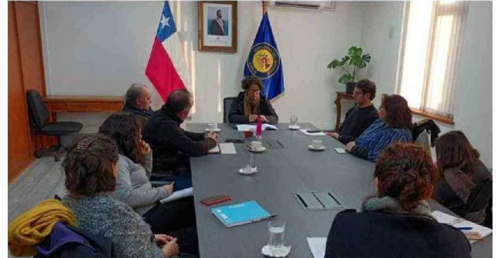
EN SU ÚLTIMA VISITA A LA REGIÓN, LA MINISTRA SE REUNIÓ CON LA AGRUPACIÓN GAYL.

Observan que es factible ejecutar obras de infraestructura verde en este sector y explican “que integrarán los futuros barrios a los humedales en proceso de declaración me-