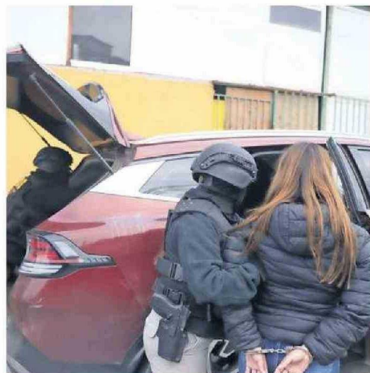
UNA DE LAS DETENIDAS POR LA PDI.