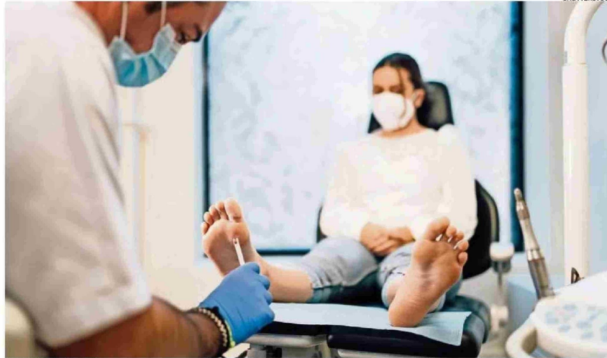
En Chile, el pie diabético es la primera causa de amputación y de hospitalización por complicaciones de la diabetes mellitus.

"Además del efecto antimicrobiano clásico de las opciones del mercado, incorpora moléculas con efecto antiinflamatorio y regenerador de los extractos naturales. A diferencia de los apósitos de