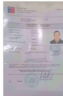
El salvoconducto que obtuvo en el consulado de Chile en La Paz.