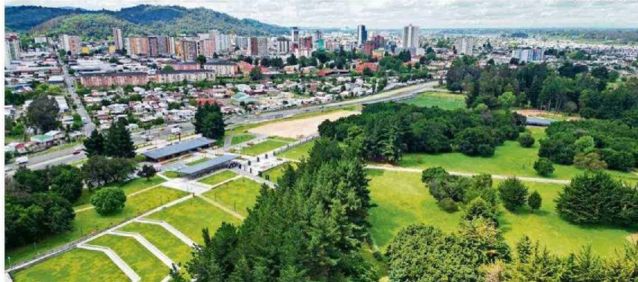
MUNICIPALIDAD DE TEMUCO