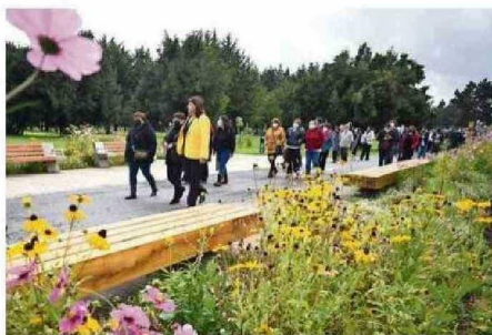
MILES DE PERSONAS VISITAN, CADA MES, EL PARQUE ISLA CAUTÍN.

“Este premio posiciona a Temuco y a Chile como referentes en materia de arquitectura y ur-