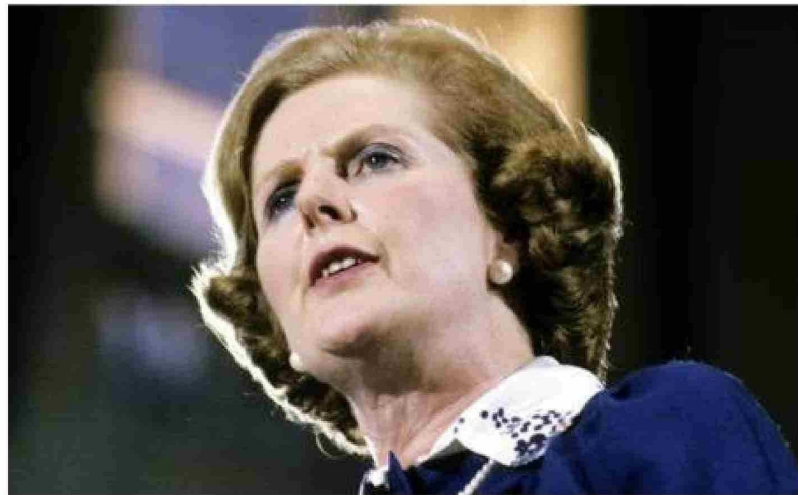
La líder conservadora Margaret Thatcher.

El movimiento huelguista de los mineros de hace cuatro décadas tiene una historia poco conocida que, tal vez, merezca