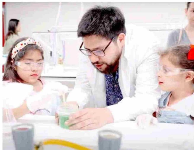
La idea es que los niños aprendan de forma entretenida y se diviertan en las vacaciones.

El miércoles 8 de enero, la Escuela de Ingeniería en Desarrollo de Videojuegos y