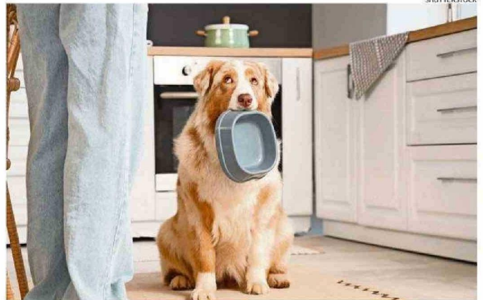
LOS PLATOS DE COMIDA ALOJAN MICROORGANISMOS Y RESIDUOS.