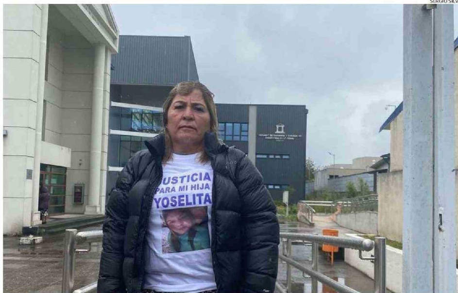
LA MADRE DE LA JOVEN ASESINADA POR SU PAREJA ESPERA QUE LOS JUECES ENCUENTREN CULPABLE AL AUTOR DE ESTE CRIMEN.