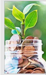
Arauco presentó por primera vez sus avances en la medición del Capital Natural de sus activos biológicos, que cuantifica el impacto y los aportes de la compañía sobre los ecosistemas.

Con el fin de reafirmar el compromiso que tiene Arauco con la sustentabilidad, la empresa logró la emisión de 10 millones de UF, en Chile, en bonos sustentables. Entre los proyectos que sustentan el financiamiento se encuentran algunos relacionados al uso sostenible de la tierra y gestión forestal, programas de gestión de agua, emisiones, residuos y el acceso a servicios básicos.